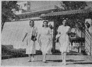
de regreso a la Casita...