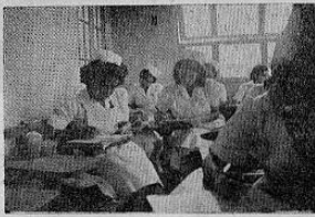
los estudios son fuertes pero placenteros...