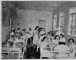
en el comedor...